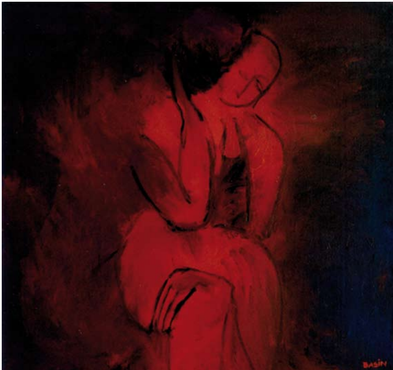
Сидящая. 1997. Холст, масло. 105x110