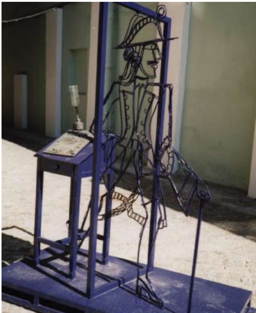
Поручик Кижэ. 2007. Инсталляция