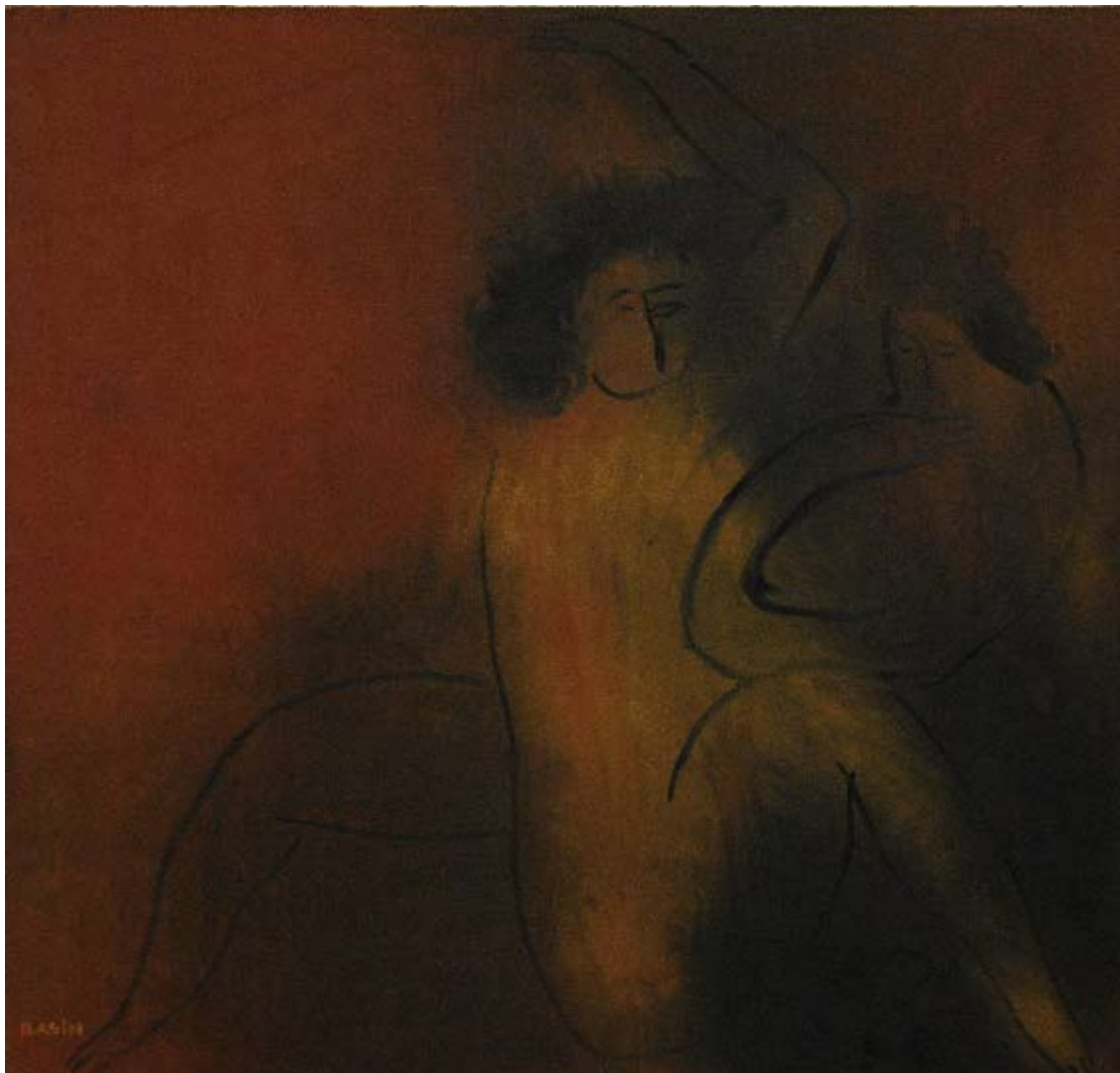
Две женщины. 2007. Холст, масло. 100x105