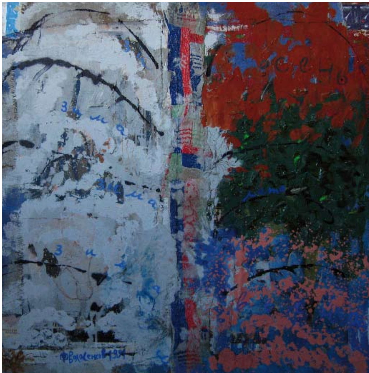
Времена года. 1994. Холст, смешанная техника. 115x110