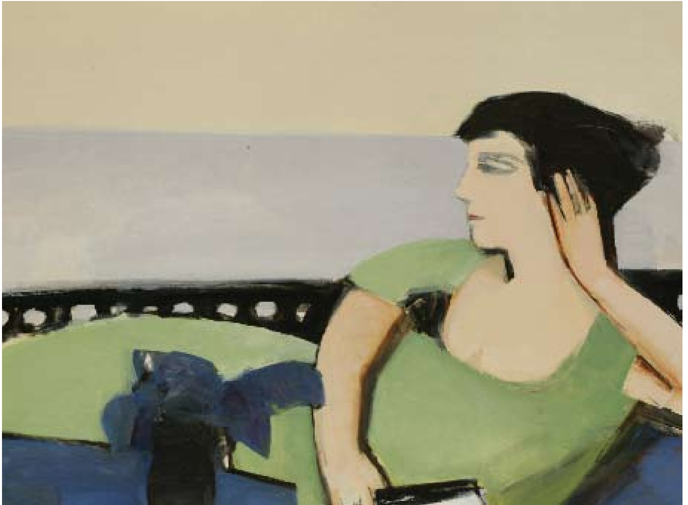
В честь Бекмана. 2006. Холст, масло. 60x80