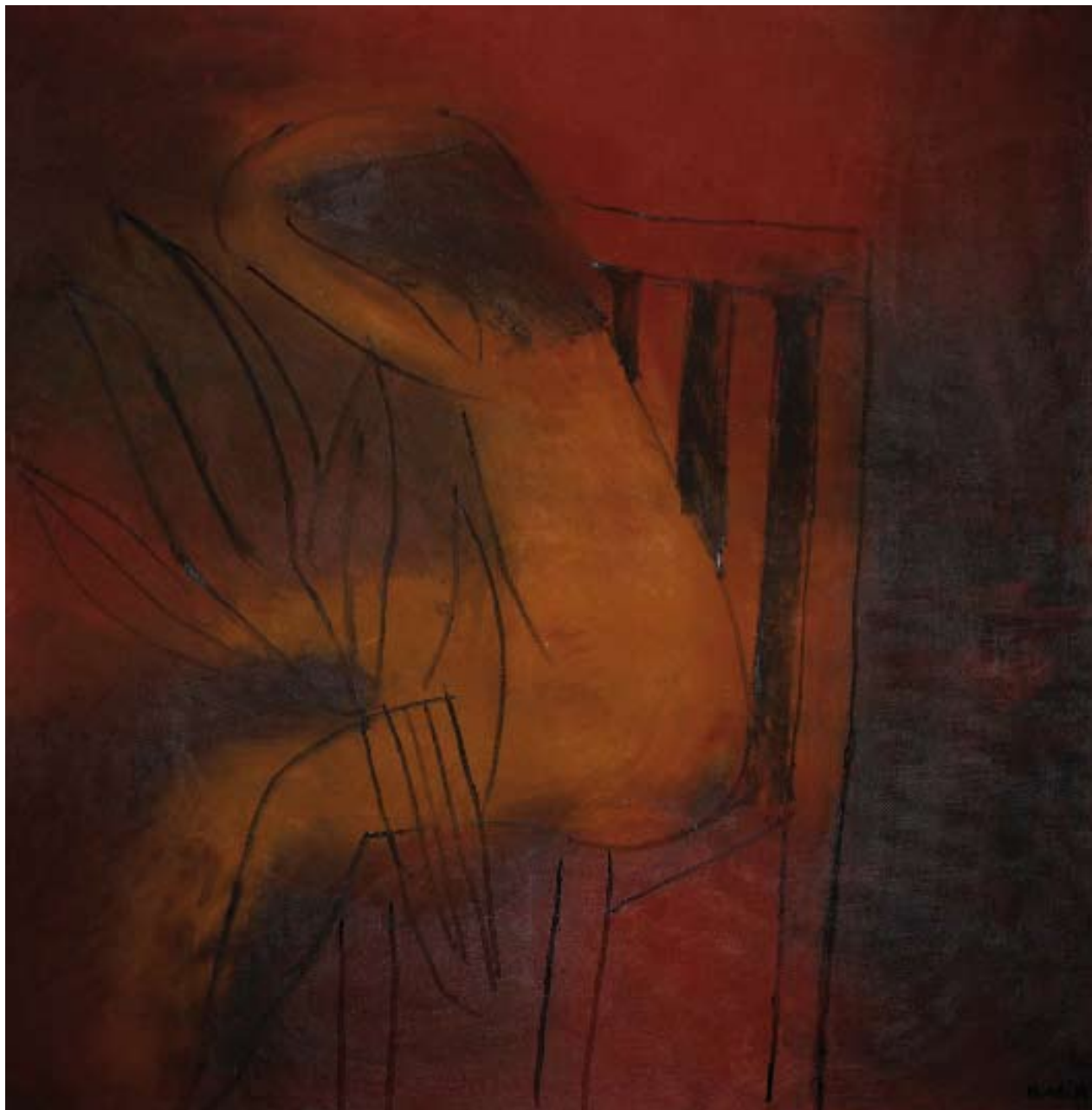
Женщина с цветком. 2007. Холст, масло. 105x100