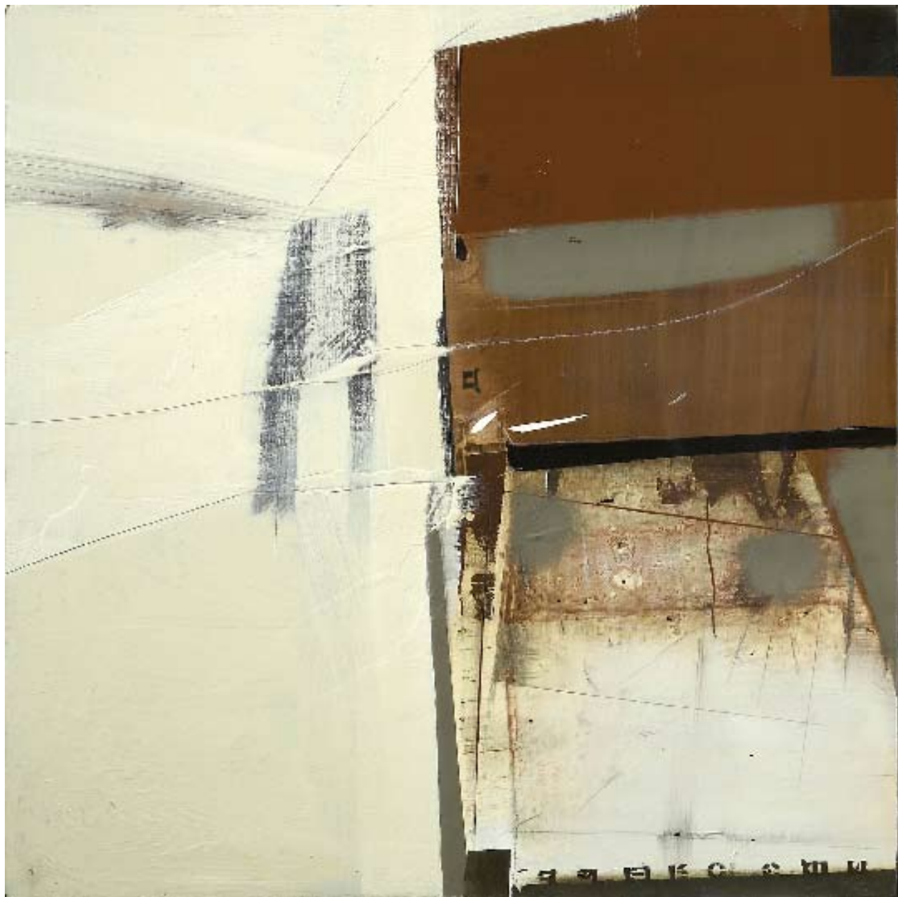
Без названия. Диптих. 2007. Холст, смешанная техника. 100x200