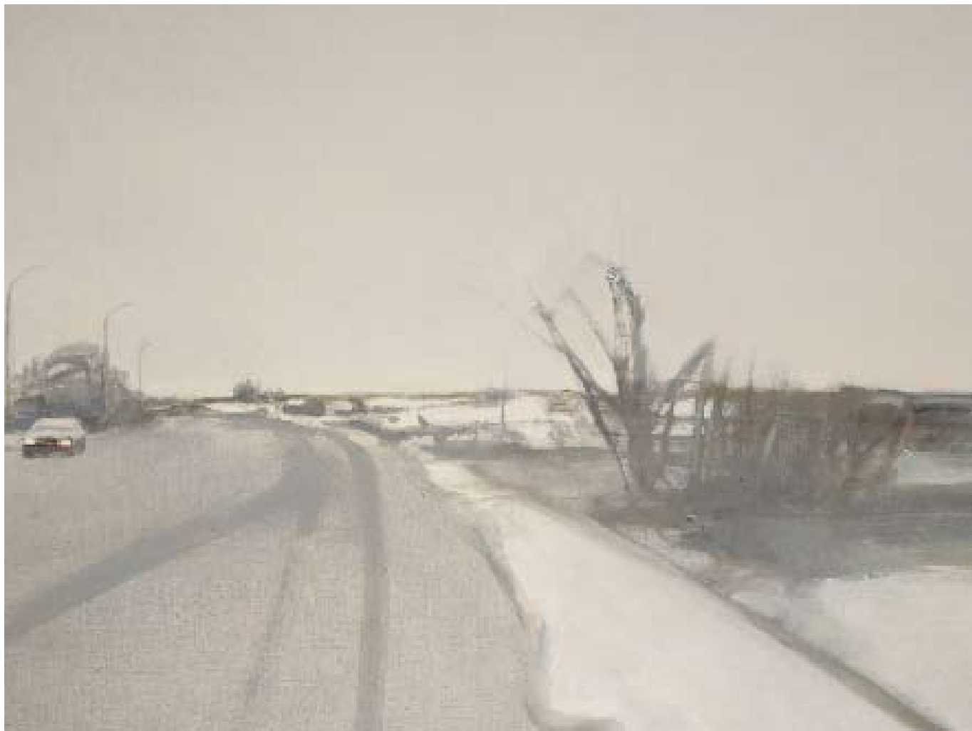
Зима. Ближний свет. 2008. Холст, масло. 60x80