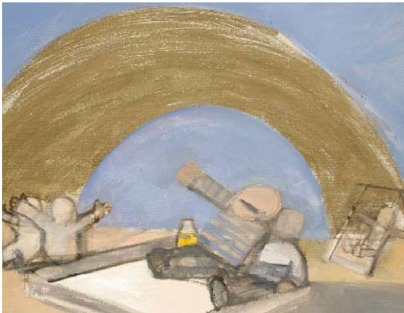
Памяти "Митьков". Радуга. 2008. Холст, масло. 55x70